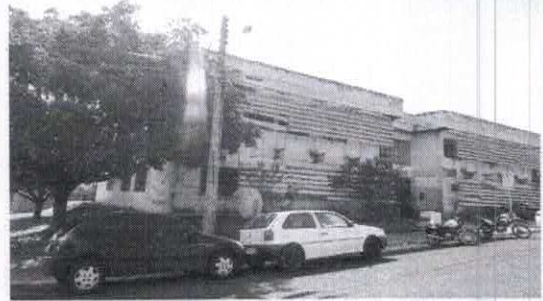
Registro de Localização.